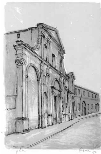
Angelo Ranzi – San Salvatore - litografia 1980