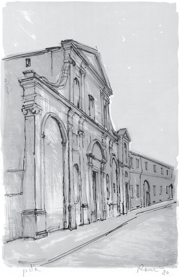
Angelo Ranzi – San Salvatore - litografia 1980