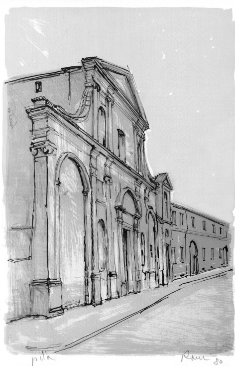
Angelo Ranzi - San Salvatore - litografia 1980

Sede della Libera Università per Adulti APS